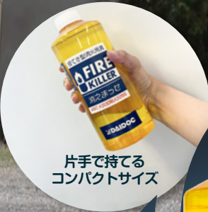
片手で持てる コンパクトサイズ