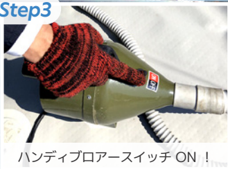
ハンディブローアースイッチ ON!