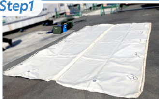
瞬間エアパネルを広げる