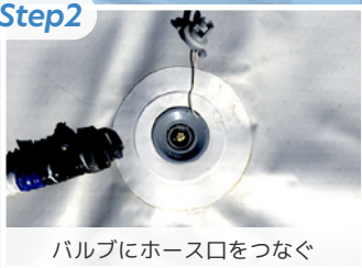
バルブにホース口をつなぐ