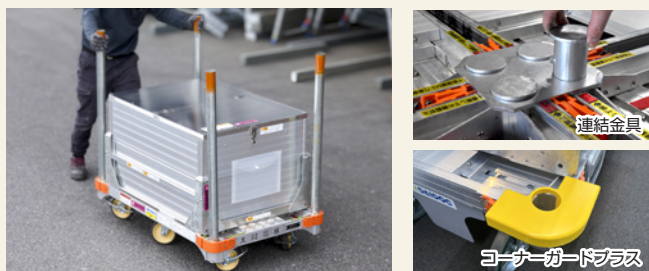
楽輪車のオプションパーツに干渉しません ▲