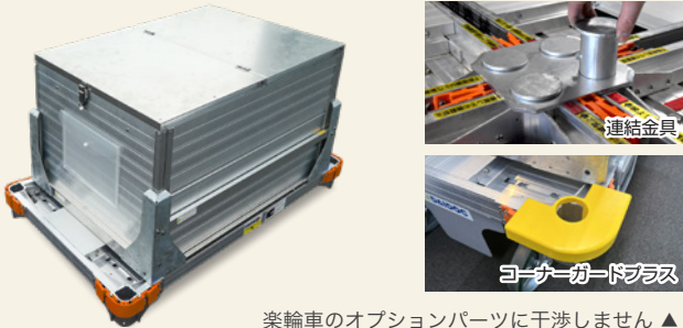
楽輪車のオプションパーツに干渉しません ▲